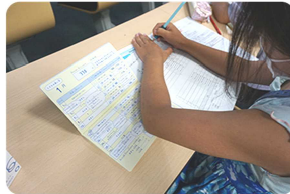
▲ はまぎん おかねの教室より。

て、資料にないエピソードを交えつつ、講演いただきました。講演時間が90分、テキストは80頁弱とボリュームが多かったこともあり、参加者の反応が不安だったとのことですが、参加者アンケートでは、「具体例を交えて話をしてくれて分かりやすかった」、「お金の向き合い方について、とても参考になった」との声が多く寄せられたとのこと。