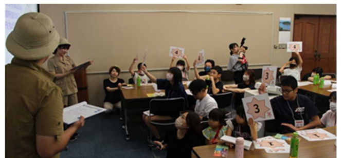
▲ 探検隊員に扮した行員が、金融クイズを出題。秋田銀行ウェブサイト ( https://www.akita-bank.co.jp/ ) より。

2023年からは、地域に根差す地方銀行として、地元の方々にも、自らの歴史に少しでも触れてほしいと考え、旧秋田銀行本店である赤れんが郷土館で開催しています。