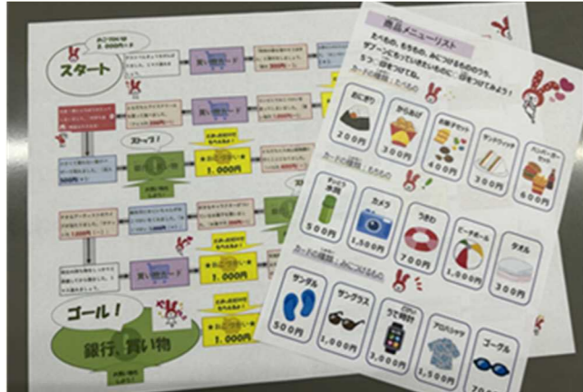
▲ 秋田銀行の独自ボードゲーム。

「あきぎんワクワク探検隊」のポイントは、なんといつでも「探検隊」であるということ。進行役の2名の行員は、「隊長」と「副隊長」として、探検服を着用して会場に登場します。探検隊への入隊式から始まり、赤れんが郷土館の外観やロビー、旧頭取室、金庫室等を見学。そして、親子参加型の金融クイズ、計画的なお金の使い方を学ぶため