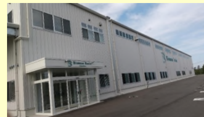
㈱バイオマスレジン福島の社屋と工場。工場にはお米の炊ける匂いが広がる

㈱バイオマスレジン福島は、2021年、相馬ガスグループとバイオマスレジングループの合併事業としてスタートし、2022年11月、浪江町にお米(非食用米)由来の国産バイオマスプラスチック「ライスレジン」の製造工場を竣工。被災地での産業と雇用の創出に加え、原料となるお米の営農再開への支援も含めた創作的復興に貢献。非食用米は、元は食用の規格外米で、適切な温度・湿度管理の下、保管されていたお米は汚れや虫いなどなく、そのまま原料としてライスレジンに加工できる。これまで捨てられていたお米がライスレジンに生まれ変わり、食品ロス削減、カーボンニュートラルに繋がる取組みでもあり、