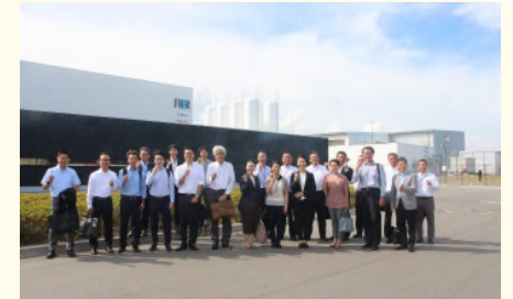
みんなでカツポーズ！視察研修会参加者たち

視察研修会の参加者は、運送会社やガス会社の経営者を中心。すでに水素トラックを導入している企業もあり、今後、事業にどう活用できるか真剣に視察。各視察先で多くの質疑応答が繰り広げられ、参加者間で活発に情報交換する姿も見られた。