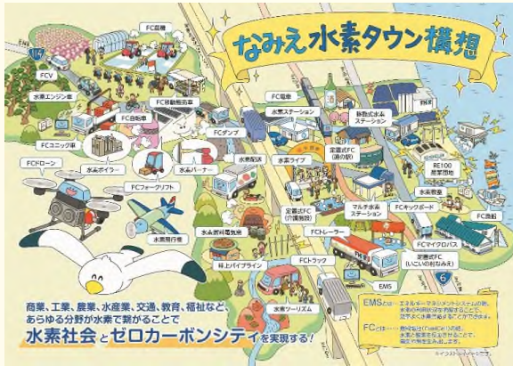
浪江町ホームページより