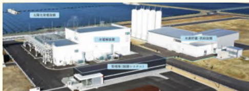
FH2Rの設備。奥に高さ約18mの水素ガスホルダーが見える

2020年3月、浪江町に福島水素エネルギーフィールド(略称FH2R)が開所した。FH2Rは、世界最大級となる1万kWの水素製造装置を備える水素エネルギー研究施設で、製造から利用に至るまでCO2を排出しないグリーンで低コストな水素製造技術の確立を目指す。約18万㎡の敷地内に設置された太陽光発電などの再生可能エネルギー由来の電力により水の電気分解を行い、水素を製造する実証プロジェクトを進めている。