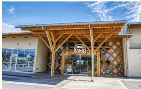
大賑わいの「道の駅なみえ」

「被災地」と思っ浪江町に足を踏み入るとと驚くことだろう。すっかり舗装されてきれいになった道路に、気持ちの良い海風が吹く。「道の駅なみえ」では、てんこ盛りしらす丼を求めて平日でも大行列。地酒コーナーの飲み比べも人気だ。甘みの強い浪江町の新たなブランド玉ねぎ「浜の輝」関連商品もズラリと並ぶ。