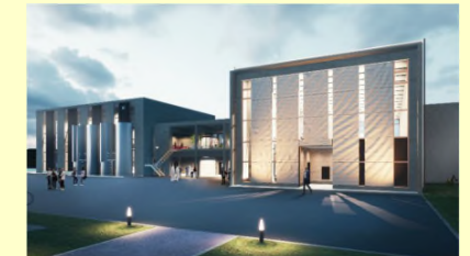
フルPC建築の「福島RDMセンター」

會澤高圧コンクリート㈱は、北海道苫小牧市に本社があり、コンクリートマテリアルと先端テクノロジーを掛け算して新たな企業価値の創造に取り組む総合コンクリートメーカー。2023年6月、浪江町に研究開発型生産拠点「福島RDMセンター」を開設、バクテリアの代謝機能を使った自己治癒コンクリートを世界で初めて実用量産化するなど、MITやデルフト工科大学など欧米トップ理系大学との産学協力を幅広く展開している。また、炭素削減の証跡データをNFTとして購入者に発行、建設関連業界で自律的に管理するコンクリート版の「脱炭素経営プラットフォーム」の運用も開始している。